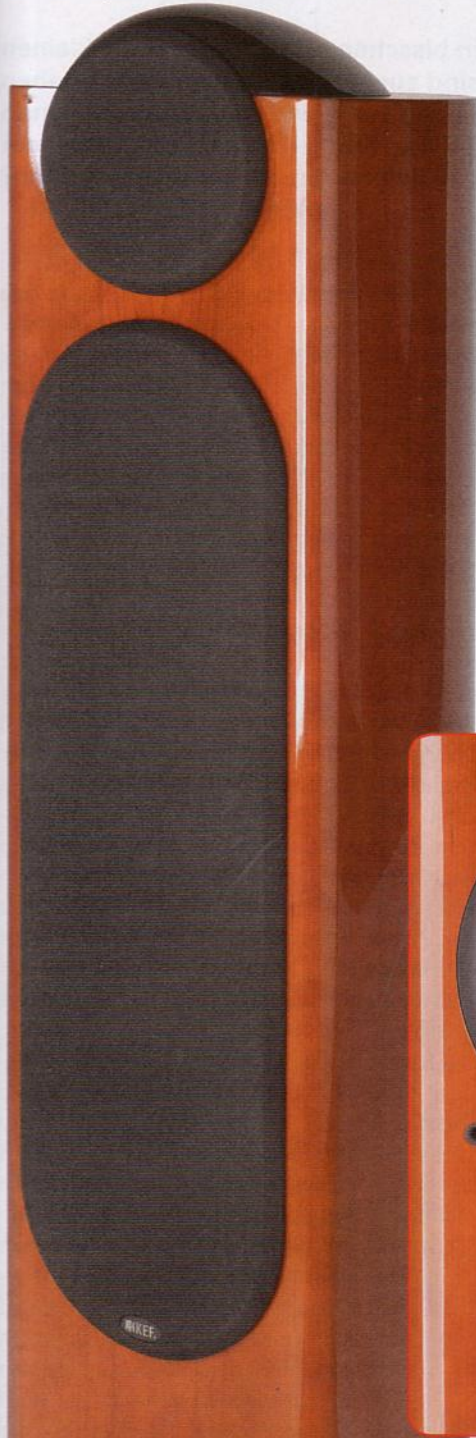
Die Reference 205/2 wird mit Abde-

Das Anschlussterminal verdient bei der KEF Reference seinen Namen wirklich. Auf einer soliden Metallplatte sind sechs WBT-Polklemmen montiert, mit das Feinste, das der Markt in diesem Bereich hergibt. Somit kann jeder der drei Wege der 205/2 mit einem separaten Kabel oder gar einer eigenen Endstufe angesteuert werden. Über den Klemmen finden wir drei Gewindelöcher, in die Kontaktschraubchen eingedreht werden können. Auf diese Weise kann der Grundtonbereich in zwei, der Hochtonbereich in vier Stufen an den Hörraum und den eigenen Hörgeschmack angepasst werden. Die gemessenen Unterschiede der Varianten sind nicht dramatisch, können aber dem experimentierfreudigen Hörer durchaus helfen, seine eigenen Vorstellungen innerhalb gewisser Grenzen zu verwirklichen.